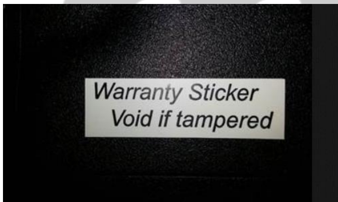
Пример гарантийной пломбы.

При наличии следов самостоятельного разбора корпуса ноутбука MSI вправе отказать в удовлетворении претензий по внешнему виду, так как неквалифицированный разбор может привести к неисправной работе механических частей ноутбука.