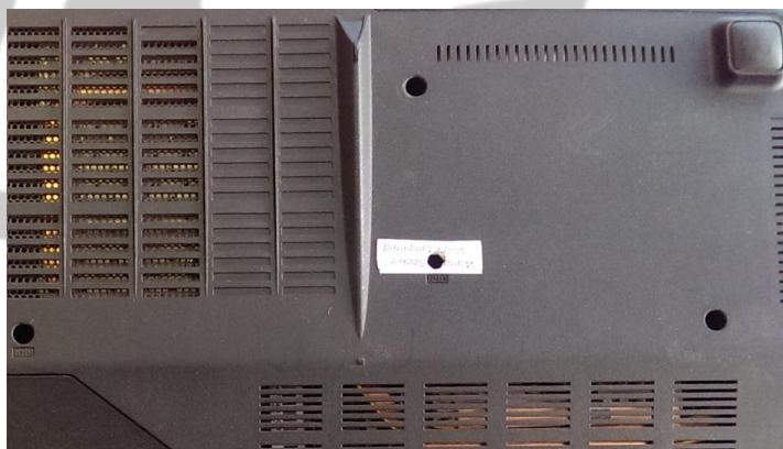
Нарушенная гарантийная пломба.