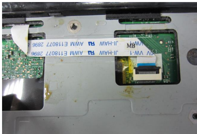
Пример наличия жидкости – отказ в гарантии