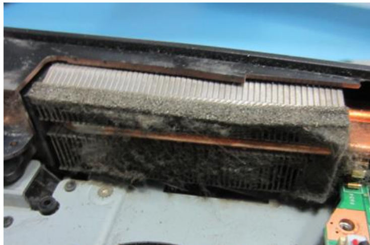
Пример нарушения правил эксплуатации с результатом – прогар видео карты. Отказ в гарантии.