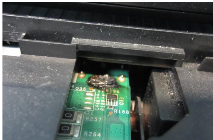
Прогар видео карты по причине нарушения правил эксплуатации.